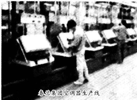
春兰集团空调器生产线

私营企业与国有、集体企业相互参股、联营或合作经营,发展股份合作制企业,鼓励有规模、有实力的私营企业兼并、租赁或承包中小型公有制企业,帮助他们做大、做强。完善有关政策、法规,搞好非公有制经济的协调和服务,为非公有制经济发展创造一个宽松环境,使今年全市非公有制经济占国内生产总值比重提高 5 个百分点。