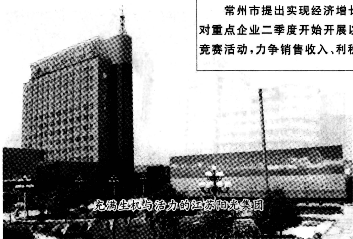
充满生机与活力的江苏阳光集团

的投入占50%以上;完成40项投资千万元以上的重点技改竣工项目。第五、确保工业集中度有较大提高。五大支柱产业增加值占全市工业增加值的比重比上年提高2个百分点;市重点企业集团销售收入和实现利润分别增长15%和11%。第六、确保工业外向型经济取得新的突破。全市自营出口要突破3亿美元,增长20%,其中自营生产企业自营出口不低于1亿美元;实际利用外资2.28亿美元,增长20%,其中利用外资嫁接改造老企业不低于1亿美元。第七、确保个体、私营工业经济健康快速发展。1998年,全市个体、私营工业企业产值突破40亿元,增长22.2%,到2000年,达到54亿元。